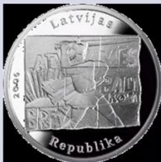
Piemiņas monēta «Janvāris. 1991». 2006. gads

Zemkopības ministrijā 2016. gada 13. janvārī notika 1991. gada barikāžu atceres 25. gadadienas pasākums, kura laikā VAS «Latvijas Pasts» prezentēja barikāžu 25. gadadienai veltīto pastmarku un aploksni.